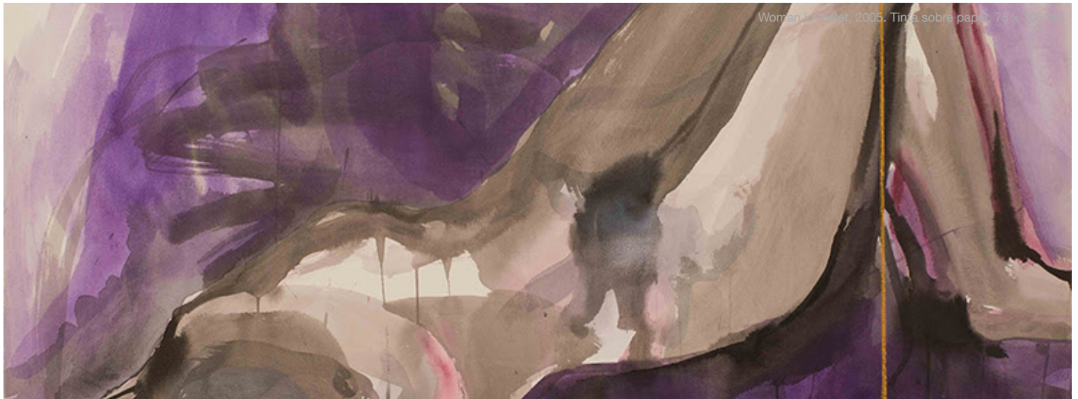
Woman in Violet, 2005. Tinta sobre papel, 74 x 105 cm