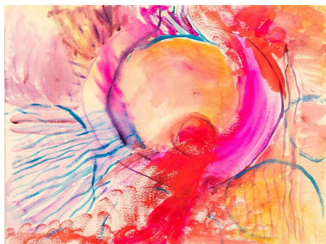
Sin título, 2012. Gouache y acrílico sobre papel, 46 x 60,5 cm.

Esta exposición póstuma muestra por primera vez su obra en España a través de dos series de pinturas creadas durante los años que Hafizi vivió en Nueva York. La primera es un conjunto de dibujos realizados en 2004 a partir de fotografías que tomó de las manifestaciones contra la Guerra de Irak en 2003.